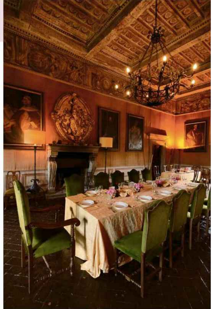
De gauche à droite: un portrait du jeune Haendel accroché dans un salon du castello Ruspoli. C'est une copie, réalisée en 1725, de celui exposé dans l'église face au château. La salle de réception où