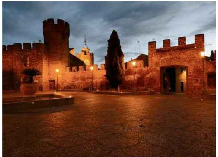
La grande place de Cerveteri (ci-dessus). Ci-dessous, la nef de la basilique Saint-Jean-de-Latran, à Rome (à gauche) et des hôtesse d'accueil en costume étrusque à l'entrée du palais Ruspoli de Cerveteri (à droite).